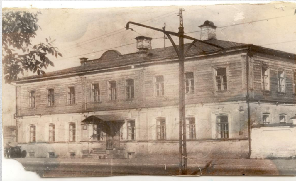
Здание школы с 1942-1949года.

В 1942-1943 учебном году школа была переведена в другое здание на улице 8 Марта, дом 55.