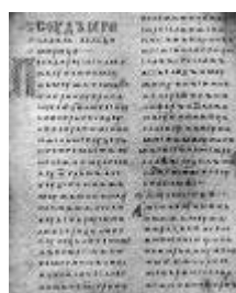
Двинская уставная грамота

Лихоимец – жадный вымогатель, взяточник».