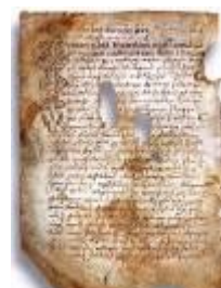
Псковская судная грамота

Двинская уставная грамота 1397 года. Мздоимство упоминается в русских летописях XIV века, например в Двинской уставной грамоте 1397 года в статье 6: «А самосуда четыре рубли, а самосуд то: кто изыснав татя с поличным, да отпустит, а себе посул возьмет, а наместники доведаются по заповеди, ино то самосуд, а опричь того самосуда нет». Там же, в статье 8: «...а черес поруку не ковати, а посула в железех не просити; а что в железех посул, то не в посул».